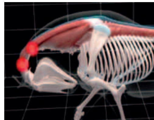
Perfekte 3D-Animation: Das zuvor markierte Pferd in einer Bewegungsstudie des Films. Rote Punkte zeigen die Schmerzzonen.