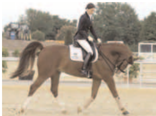
Leider kein seltenes Bild: Pferde werden in Hyperflexions-Haltung, sprich: rollkurartig geritten.

Hier geht es zum Film-Trailer und zur Diskussion im Forum: www.cavallo.de/stimmenderpferde